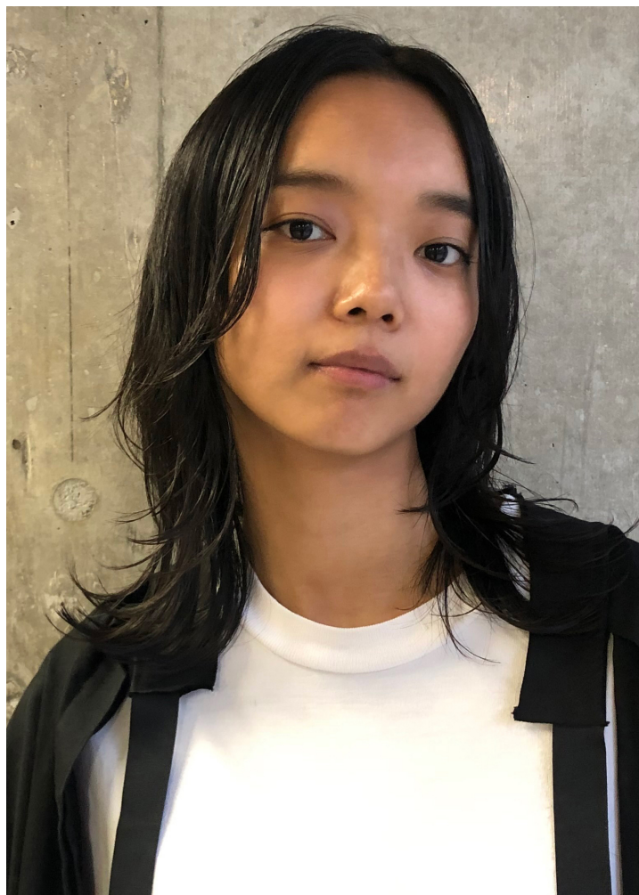
※現在はセミロング